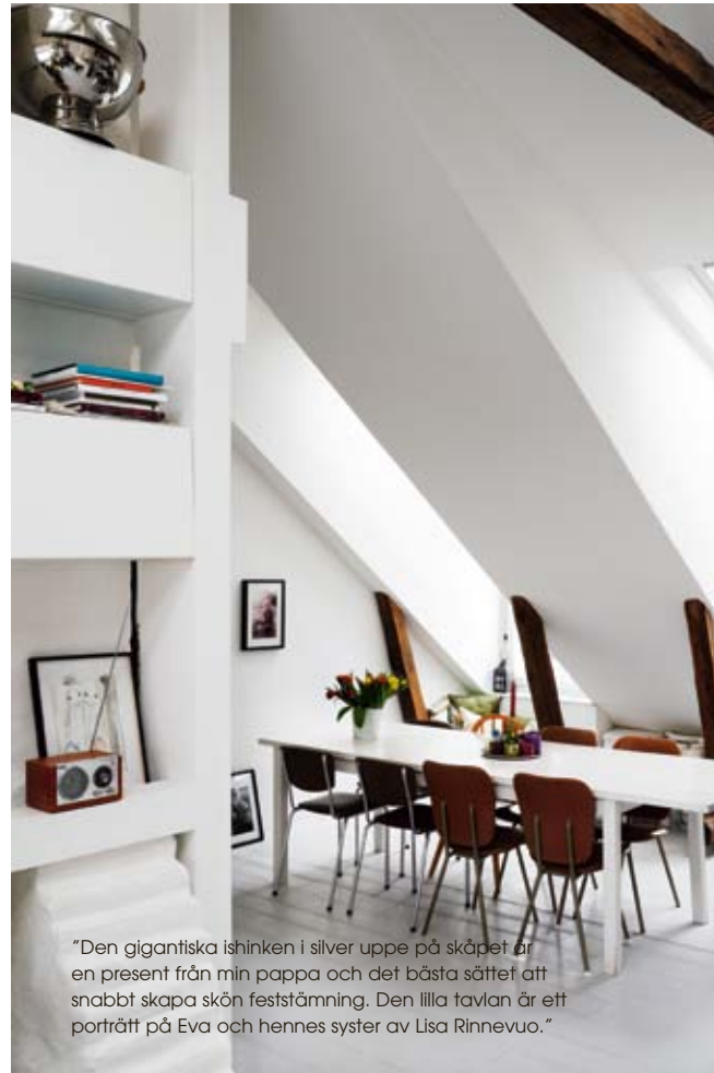
"Den gigantiska ishinken i silver uppe på skåpet är en present från min pappa och det bästa sättet att snabbt skapa skön feststämning. Den lilla tavlan är ett porträtt på Eva och hennes syster av Lisa Rinnevu."