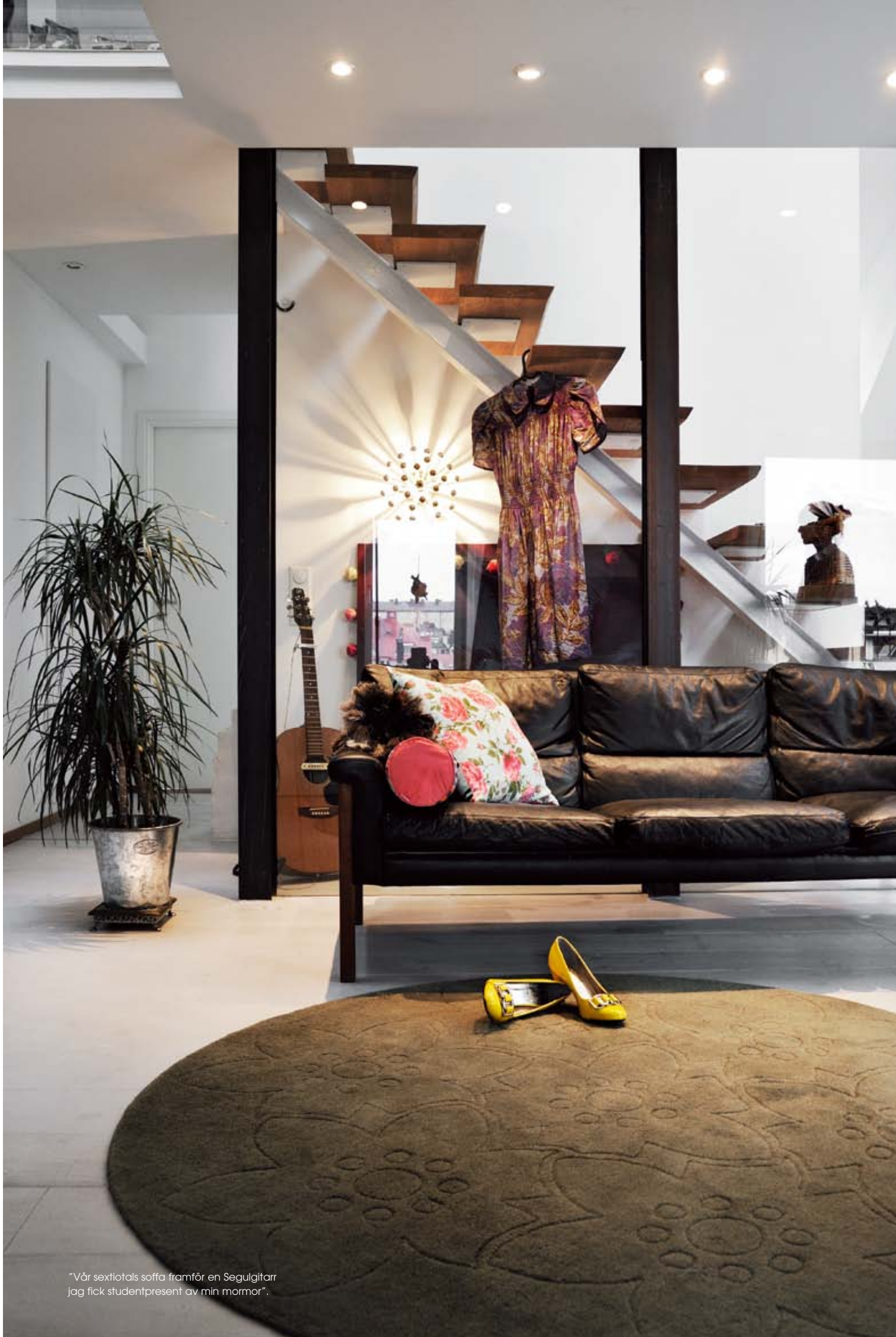
"Vår sextiotals soffa framför en Segulgitar jag fick studentpresent av min mormor".